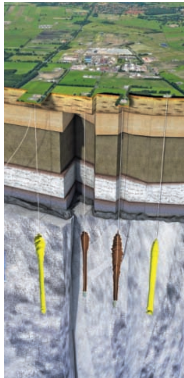
Blick in die Tiefe: Schnittdarstellung der Öl- und Gaskavernenanlage in Etzel, Ostfriesland.