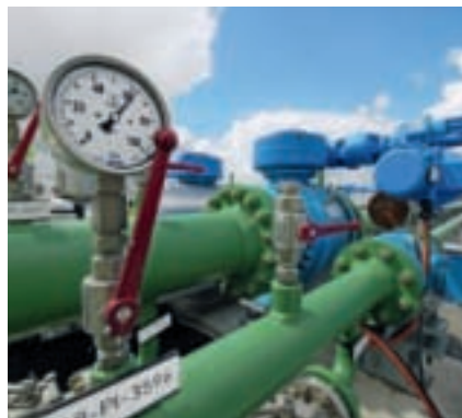
Rohre, Leitungen und Manometer bestimmen das Bild.