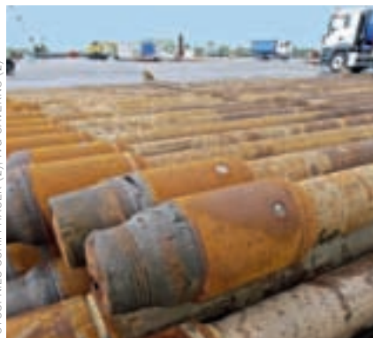
Mit verschraubbaren Gestängen werden die Kavernen erbohrt.