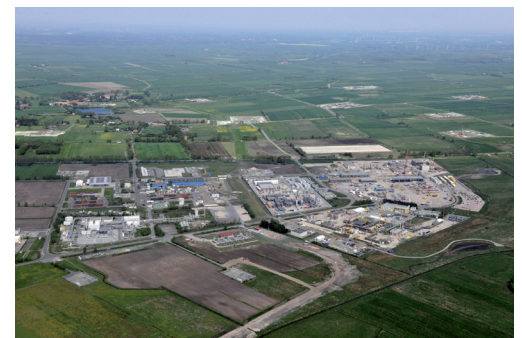
IVG Kavernenanlage am Standort Etzel

Vom Flughafen Bremen mit dem Taxi/Mietwagen ca. 1,5 h Anfahrtszeit.