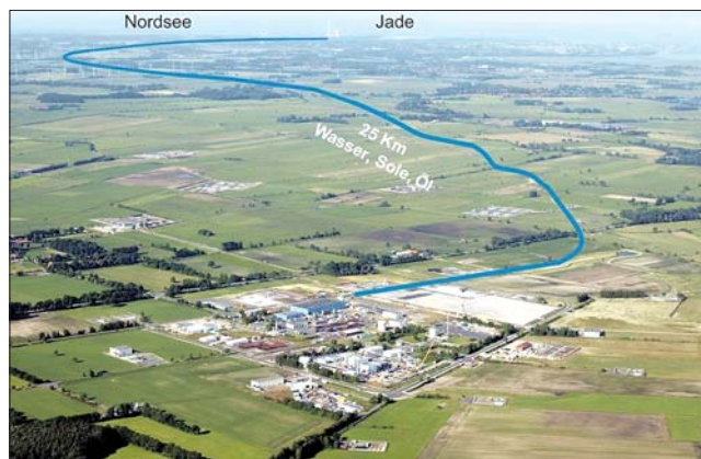
IVG Pipelines von Wilhelmshaven zum Kavernenfeld Etzel.

Nach etwa drei Jahren ist soviel Salz gelöst und Sole aus der Kaverne heraus transportiert worden, dass ein Hohlraum von bis zu 70 Meter Durchmesser und 300 bis 500 Meter Höhe entstanden ist. Nach Fertigstellung werden die Kavernen mit Öl, das über die Pipeline aus Wilhelmshaven angeliefert wird, oder mit Erdgas über die vorhandenen internationalen Pipelines befüllt.