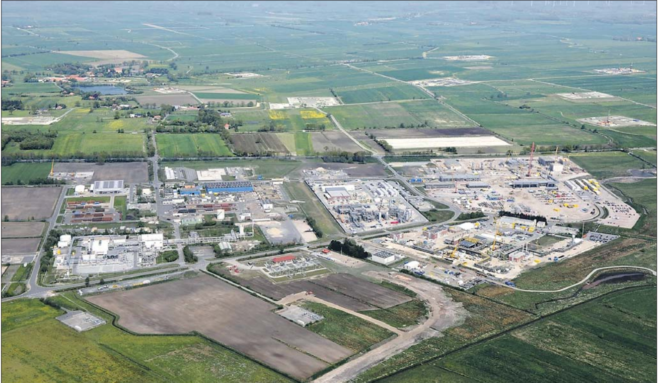
Die Unternehmen am Standort Etzel im Frühjahr 2011.